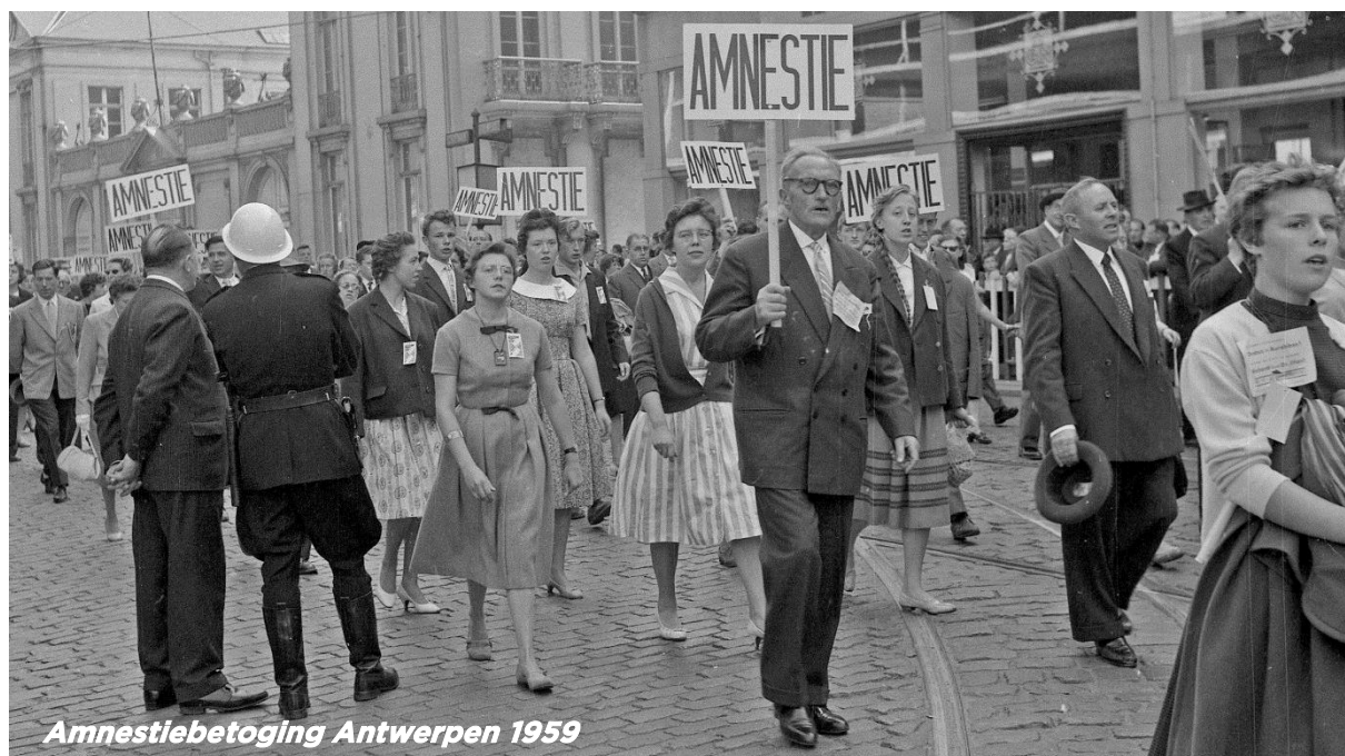
Amnestiebetoging Antwerpen 1959

In deze aflevering zien we hoe oud-collaborateurs en hun kinderen zich na de oorlog opnieuw toonden op het publieke forum. Dikwijls vanuit een Vlaams-nationalistische drijfveer verenigden oud-collaborateurs zich, werden ze opnieuw politiek actief of gingen ze in een nationalistische jeugdbeweging. Die dynamieken werken tot op vandaag door.